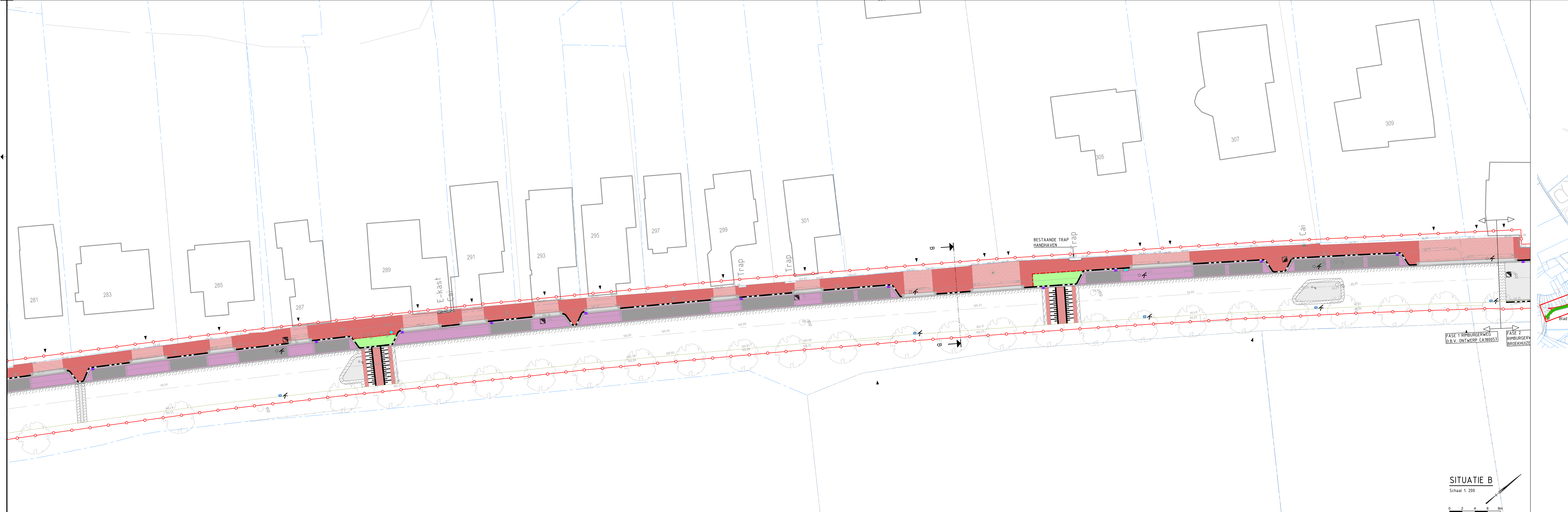
SITUATIE A Schaal 1:200